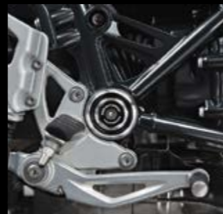
▼ Заглушки Machined