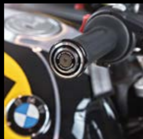
▲ Грузики руля Machined