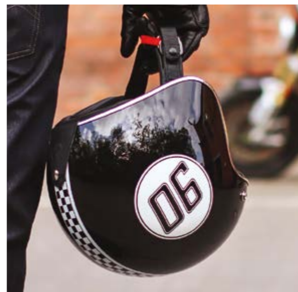
▲ Цвет NineT

Идеальное дополнение к BMW R nineT, открытый шлем Legend имеет ретро-дизайн и самые современные технологии защиты головы. А еще он невероятно легкий и представлен в трех потрясающих расцветках.