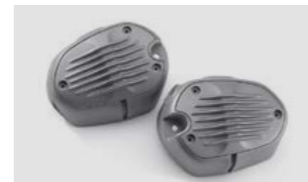
▲ Крышки цилиндров 2V-Style

Если вам близок ретро-стиль, клапанные крышки 2V-Style – настоящий must have! Эти алюминиевые детали кардинально изменят облик вашего R nineT, сделав его еще более похожим на классические мотоциклы BMW.