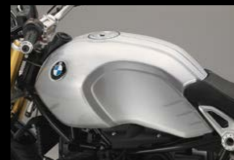
▲ С видимым сварным швом