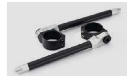
▲ Регулируемые клипоны

Позволяют придать мотоциклу вид кафе-рейсера и обеспечивают более спортивную посадку.