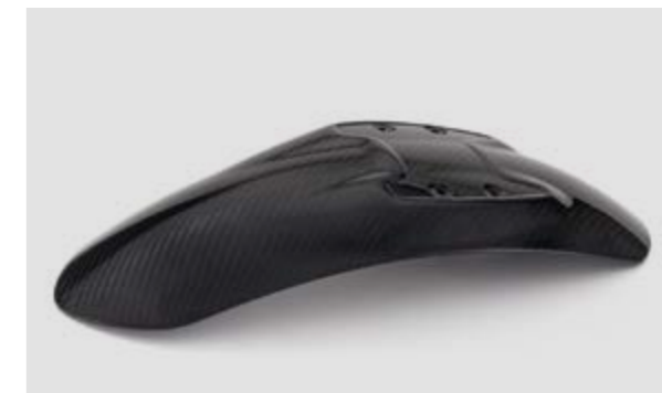
▲ Переднее крыло HP Carbon