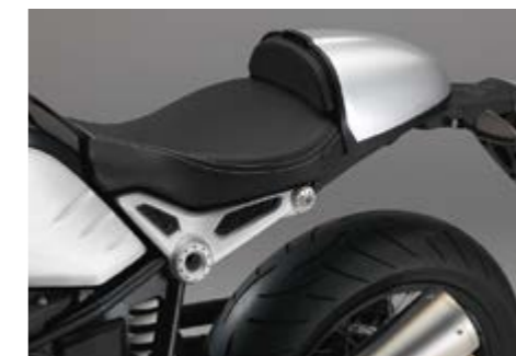
▲ R nineT / R nineT Pure

Мы никогда не скрывали, что BMW R nineT – мотоцикл для эгоистов. Так почему бы не превратить его в одноместный с помощью специального сиденья?