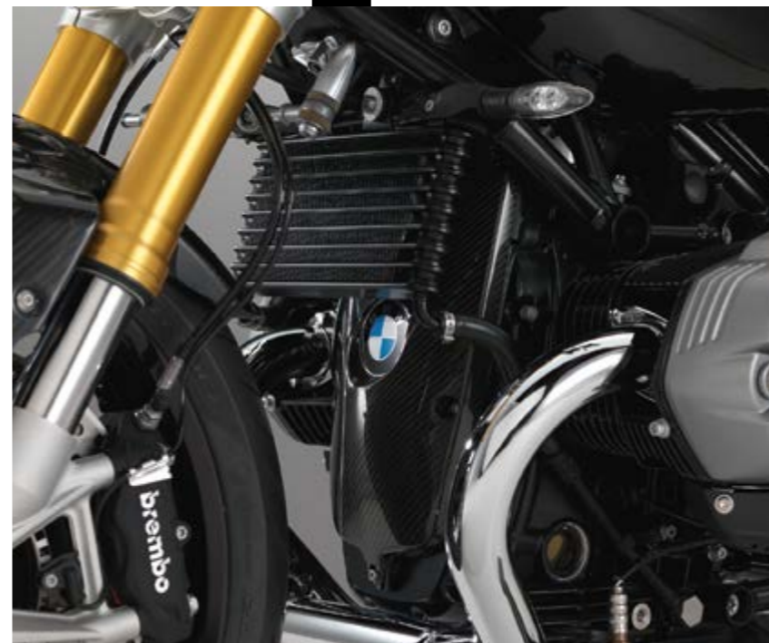
▲ Крышка ремня HP Carbon