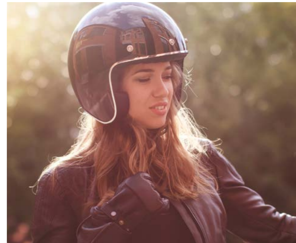
▲ Black Storm

Идеальное дополнение к BMW R nineT, открытый шлем Legend имеет ретро-дизайн и самые современные технологии защиты головы. А еще он невероятно легкий и представлен в трех потрясающих расцветках.