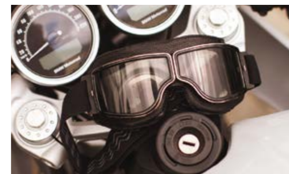
▲ Очки Legend