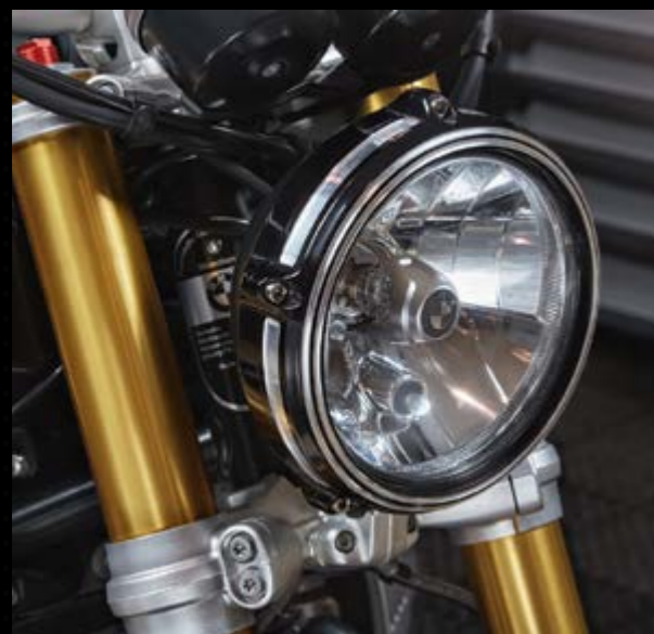
▲ Окантовка фары Machined