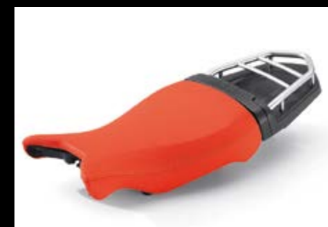
▲ R nineT Urban G/S

* BMW R nineT Racer уже в стандартной комплектации имеет одноместное сиденье