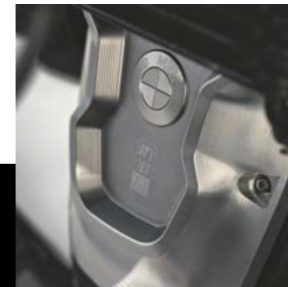
▲ Стиль Storm