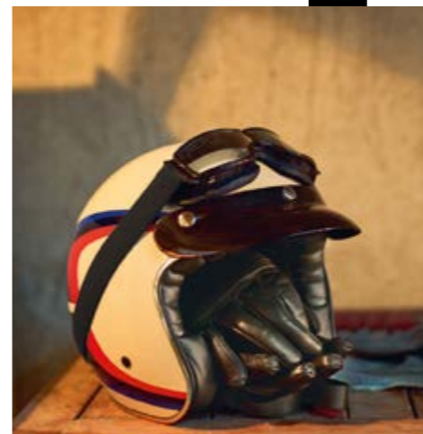
▲ Цвет Tricolor