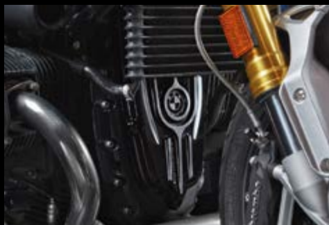
▲ Крышка ремня Machined