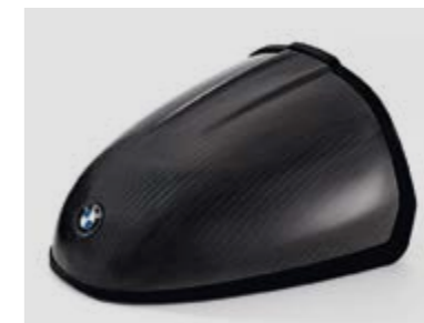
▲ Задний «горб» HP Carbon

В строгий ретро-стиль BMW R nineT уместно добавить немного хай-тека. Благодаря углепластиковым деталям HP Carbon вы преобразите свой мотоцикл так, что его будет не узнать.