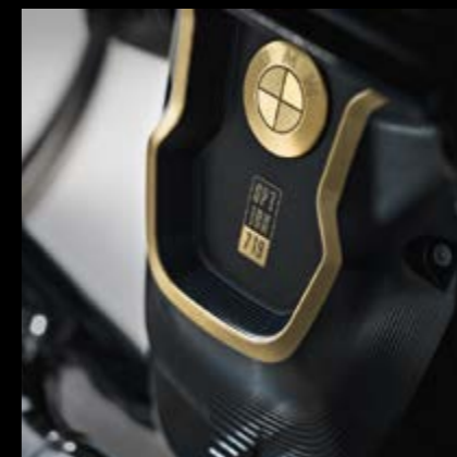
▼ Стиль Club Sport