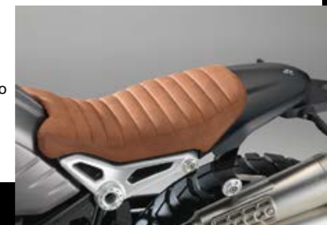
▲ R nineT Scrambler