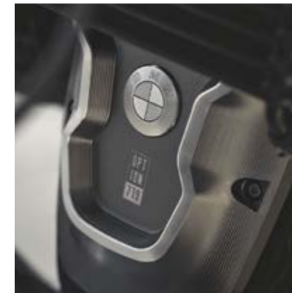
▲ Стиль Classic

Пакет опций 719 включает в себя фрезерованные крышки ремня и цилиндров, расширительных бачков и маслозаливной горловины, регулируемые подножки, крепление сиденья, а также регулируемые рычаги тормоза и сцепления.